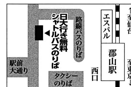
【シャトルバス時刻表】